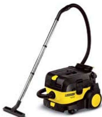
NT 14/1 Eco

Extra große und gummibereifte Räder machen den NT 14/1 zum echten mobilen „Fahrzeug“, das auch Stufen mühelos nimmt.