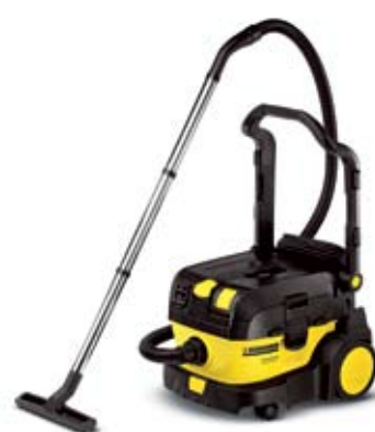
NT 14/1 Eco Advanced